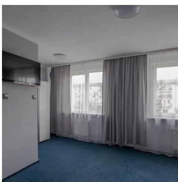
lokalizacja w budynku